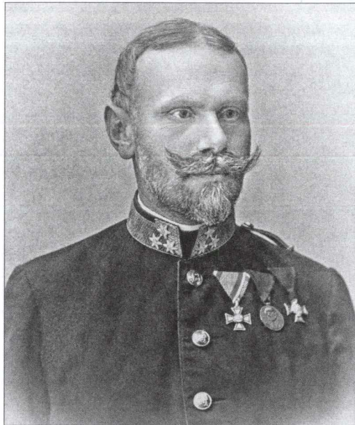
Полковник 13-ї артилерійської бригади. Фото 1898–1908 років із колекції автора

З 1-го січня 1894 року артилерійські полки передали до складу піхотних дивізій. У складі артилерійських бригад залишили корпусні полки, а з 42-х окремих дивізіонів створили 42 дивізійні артилерійські полки (Division-Artillerie-Regimenten №№ 1–42). Тепер до складу артилерійської бригади входив 1 корпусний полк і 3 дивізійні артилерійські полки. Нумерація була наскрізною, тобто до складу 1-ї артилерійської бригади входили: 1-й корпусний полк і 3 дивізійні артилерійські полки №№ 1–3, і так далі. Військовослужбовці цих підрозділів носили на своїй уніформі номер-