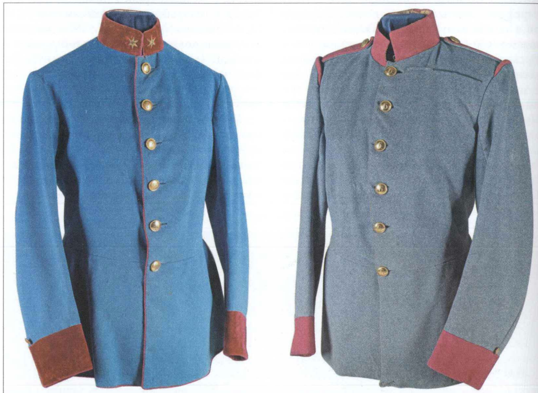
Однострої лейтенанта 7-го батальйону саперів (ліворуч) і солдата 6-го батальйону саперів.

68 років. 18 січня 1850 року у складі збройних сил були сформовані 16 полків жандармів (Gendarmerie-Regimenten №№ 1–16), військовослужбовці котрих носили номери своїх полків на гудзиках із жовтого металу 15 . Полки мали наскрізну нумерацію, і в їхньому найменуванні зазначалося, для яких коронних земель вони були створені. Така структура