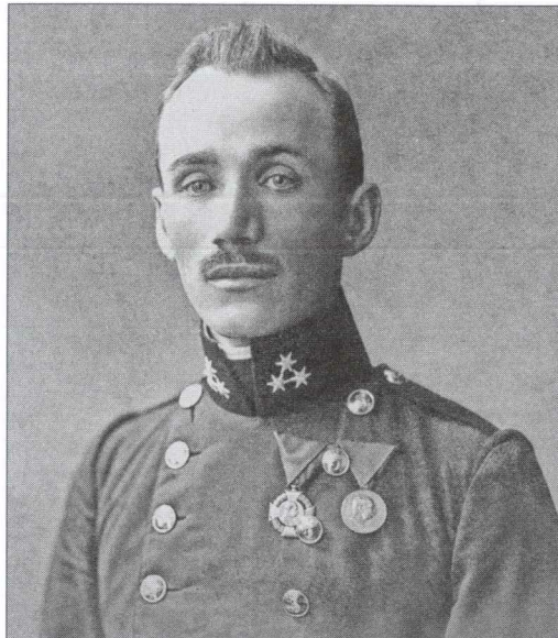
Гауптман 5-ї земельної жандармської команди м. Львів. Фото поч. XX століття з колекції автора