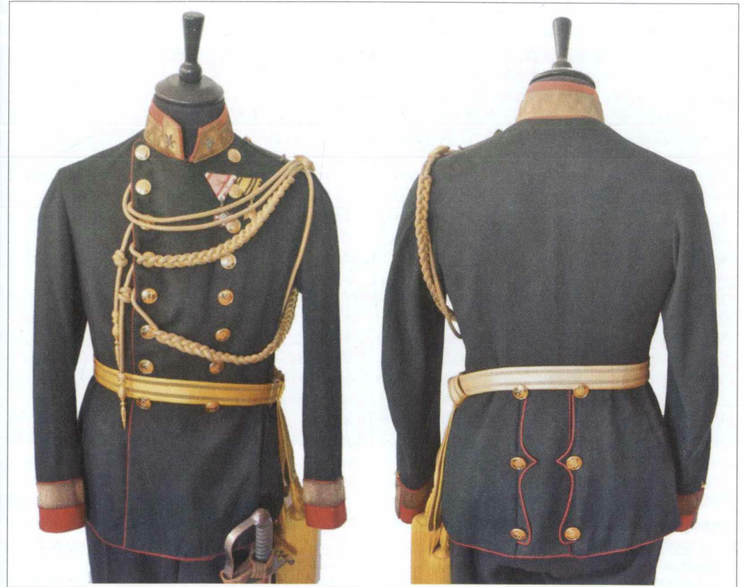
Однострій майора 3-ї земельної жандармської команди (спереду і зі спини).

На хвилі нових реформ в імперії, в 1873 році, відбулися і адміністративні зміни у Цислейтанії, що призвело до чергової реформи жандармів. 1876 року жандармів з військового міністерства передають до міністерства ляндрверу (імперсько-королівської краювої оборони). Кількість команд знов зростає, і їх стає 16 (№№ 1–16). Потім, у тому ж 1876 році, дві команди (№№ 8 і 9) було передано до міністерства гонведу (королівсько-угорської краювої оборони), і остаточно їх залишилося