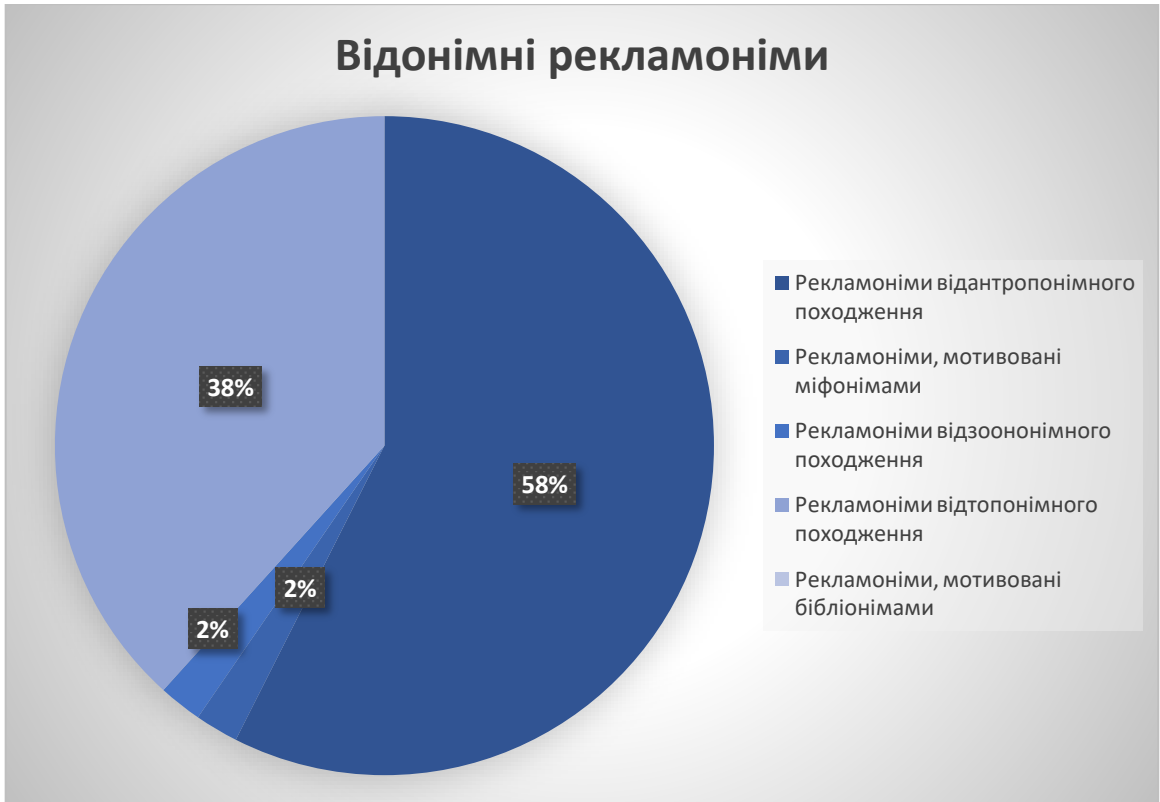
Додаток до підрозділу 2.2.1. Відонімні рекламніми