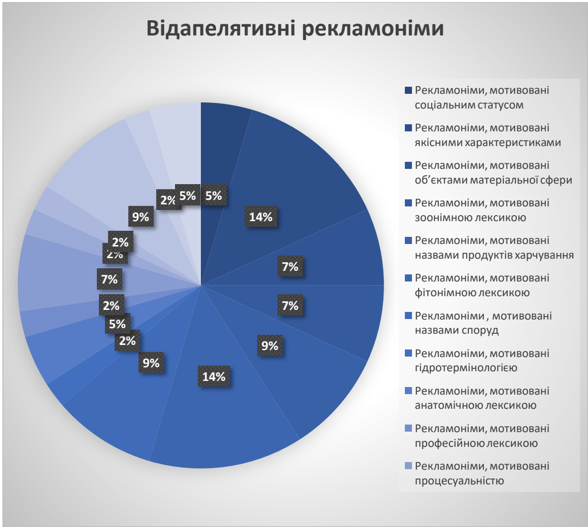
Додаток до підрозділу 2.1.1. Відапелятивні рекламонеіми