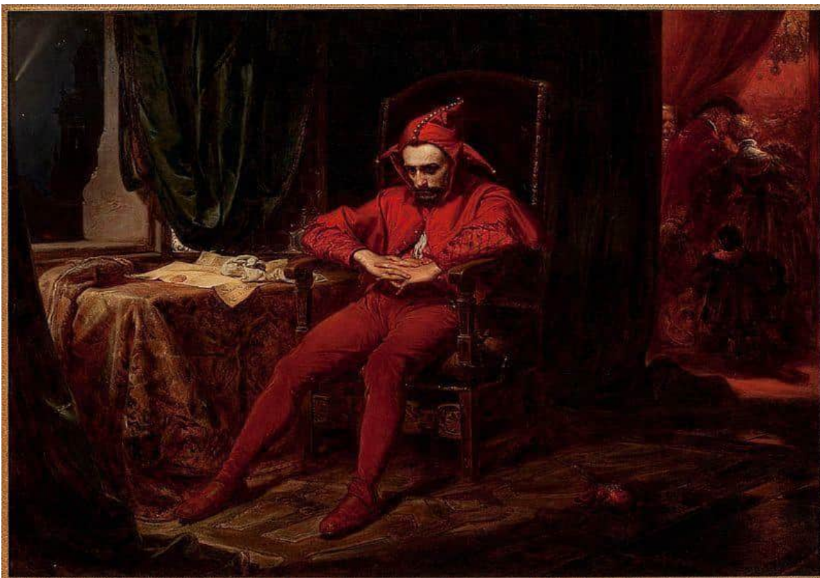
Ян Матейко «Блазень Станьчик»