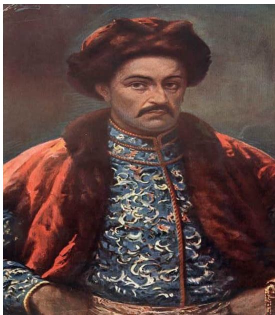
Осип Курилас . Портрет Івана Мазепи