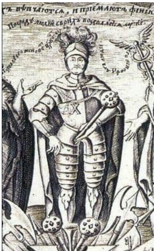
Іван Мігура. З конклюдії на честь І.Мазепи