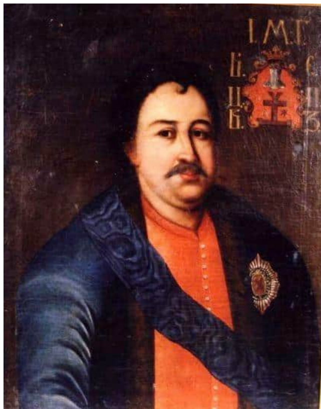
Портрет І.Мазепи з колекції Бутовичів