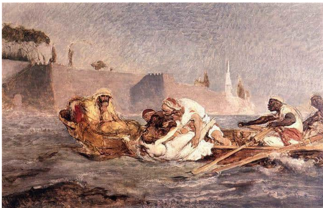
Ян Матейко «Хасан топить зрадливу дружину»