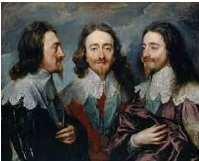
Антоніс ван Дейк. «Король Карл І у трьох ракурсах»