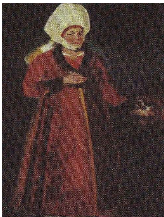
Г.Хоткевич. Копія портрета матері гетьмана Мазепи Марії-Магдалини ( з архіву родини Лепких)