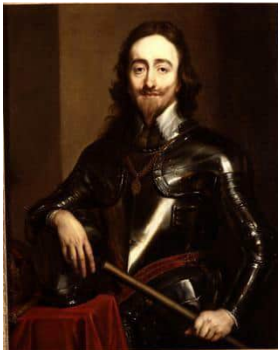
Антоніс ван Дейк. «Карл I (король Англії)»