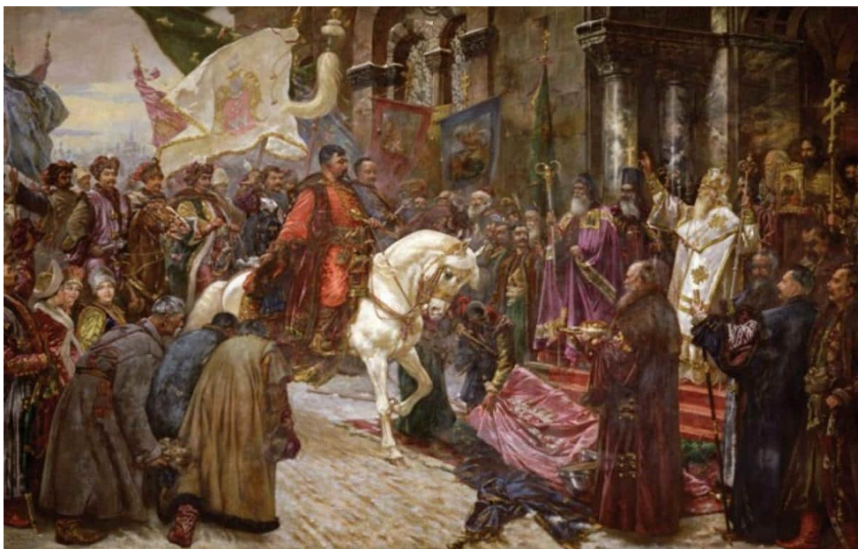
Микола Івасюк «В'їзд Б.Хмельницького до Києва 1649 року»