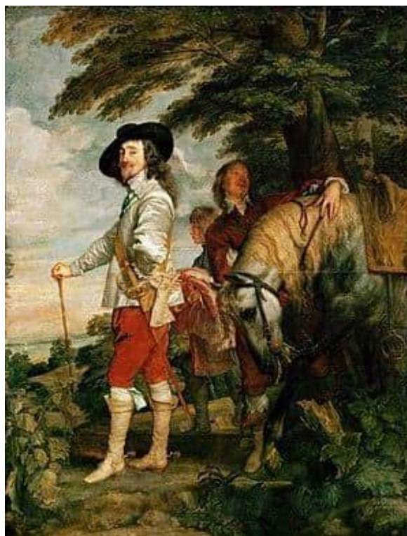
Антоніс ван Дейк. «Карл I, король Англії, на полюванні»